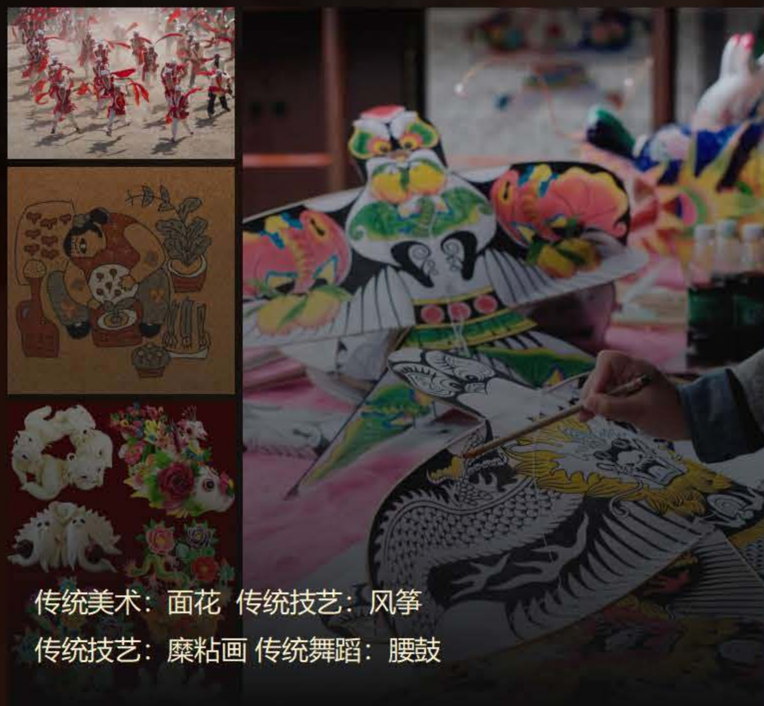
传统美术：面花 传统技艺：风筝 传统技艺：糜粘画 传统舞蹈：腰鼓