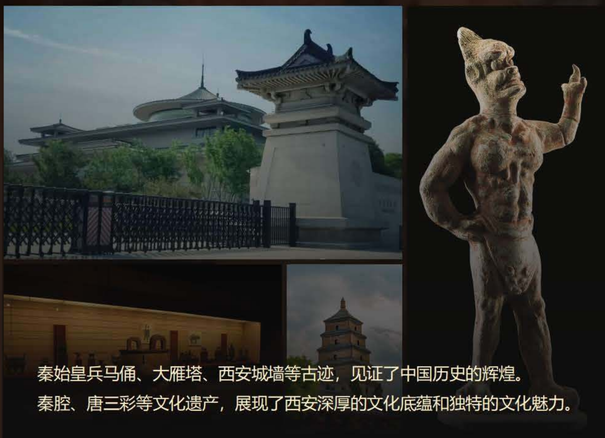
秦始皇兵马俑、大雁塔、西安城墙等古迹，见证了中国历史的辉煌。 秦腔、唐三彩等文化遗产，展现了西安深厚的文化底蕴和独特的文化魅力。