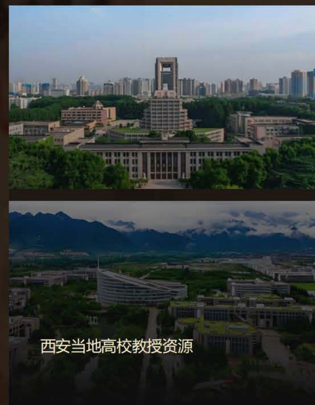
西安当地高校教授资源