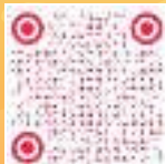
神厨小福贵小红书